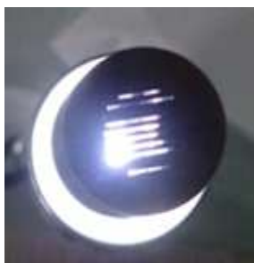
ライトの光が透過