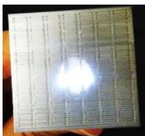
ライトの光が透過